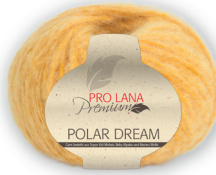
Farbe Nr. 22 gelb