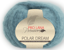
Farbe Nr. 15 petrol