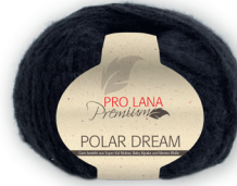
Farbe Nr. 99 schwarz