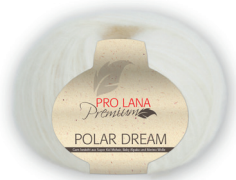
Farbe Nr. 02 natur

32% Polyamid 27% Super Kid Mohair 27% Alpaka 14% Merino Lauflänge 125m/50g Nadelstärke 6,0 – 7,0