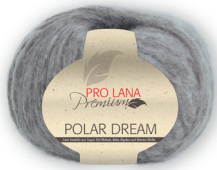
Farbe Nr. 18 sand