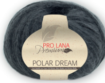
Farbe Nr. 97 anthrazit