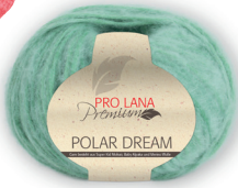
Farbe Nr. 61 hellgrün