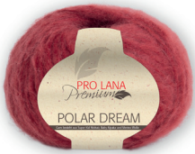
Farbe Nr. 31 rot