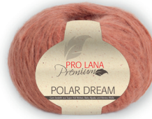
Farbe Nr. 27 ziegel