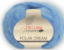
Farbe Nr. 55 himmel